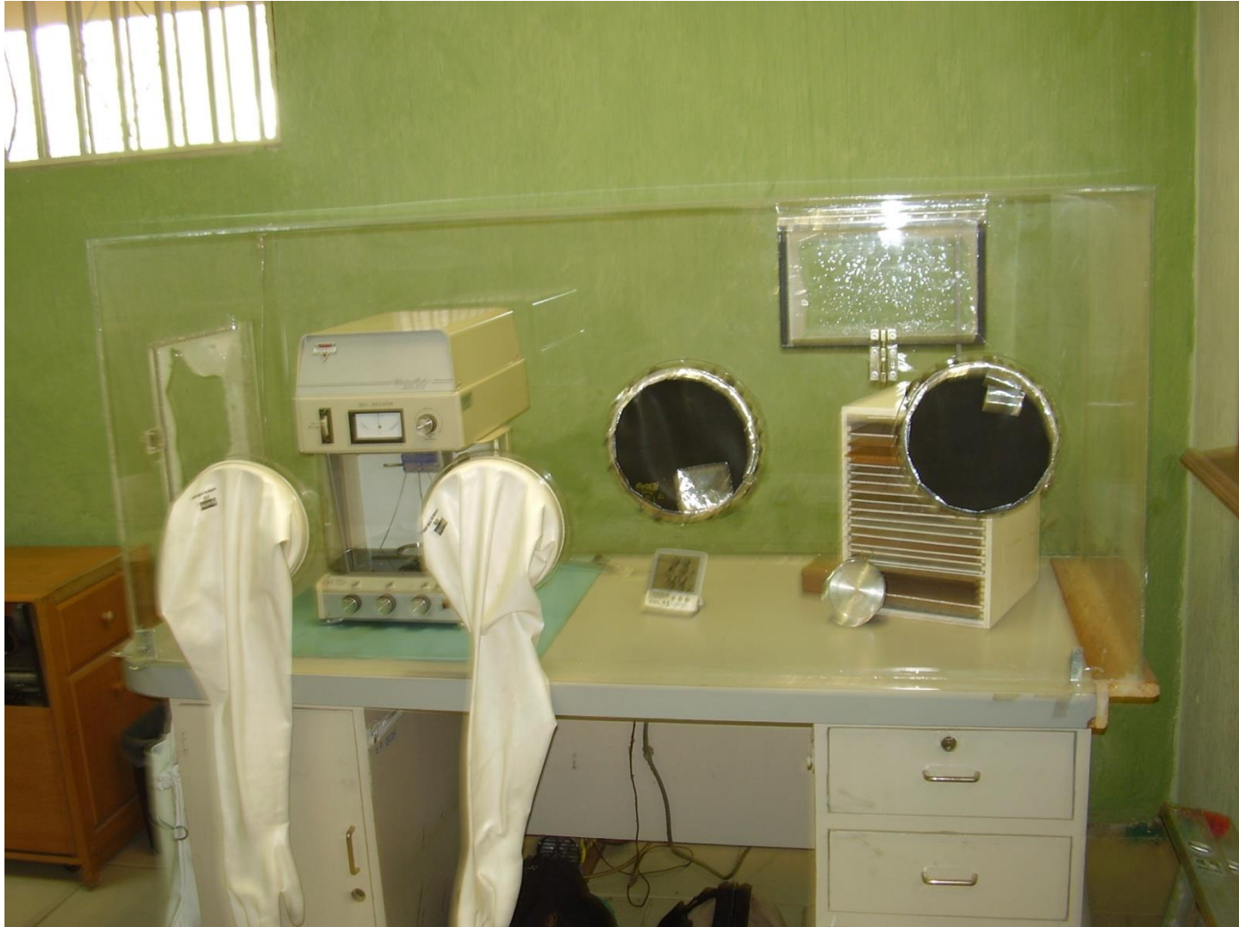
Báscula para pesaje de filtros de partículas, (160 gr. de capacidad)