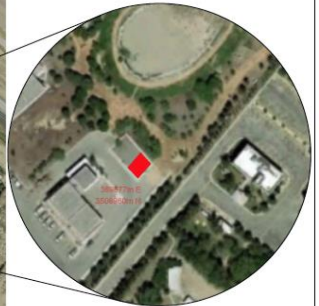
UBICACIÓN MAPA SIN ESCALA