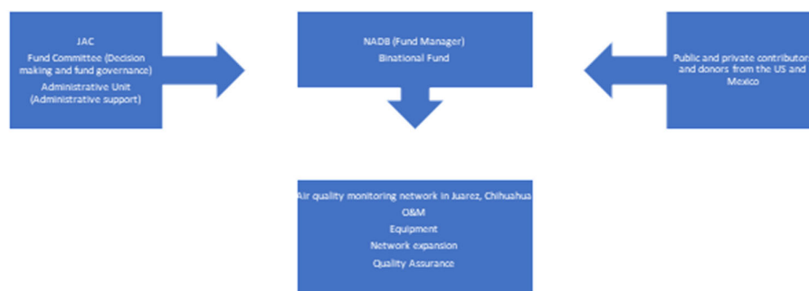
Figura 1. Estructura de FCA.

Durante la 78ª reunión de la JAC el 11 de febrero de 2021 , los miembros aprobaron por unanimidad la Resolución para la creación de las comisiones técnicas para apoyar al Fondo Administrativo para el Monitoreo de la Calidad del Aire en la Cuenca Atmosférica del Paso del Norte, basado en el Desarrollo de América del Norte , que crea dos comisiones técnicas (Comité del Fondo y Unidad Administrativa) para gobernar y brindar apoyo administrativo al FCA, estableciendo los integrantes y sus responsabilidades.